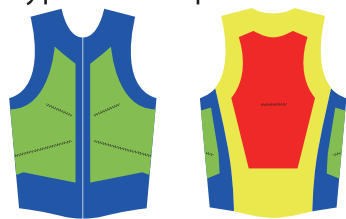
Type A color pattern