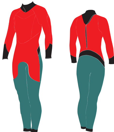
※ 裏面の素材仕様イラストです

一見普通の糸に見えて、その中心に空洞を持ち、多くに空気層を形成する中空糸と 回収されたPET端材などからマテリアルリサイクルにより生まれ変わったリサイクル糸とを ほぼ半数の割合で編み込んだDRYMAX ECO これらの全てをポリエステル素材にすることで圧倒的な乾きの早さを実現しました。 波乗り中の快適さはもちろん、波乗り後も裏返して干せば、瞬時に水分をドロップさせ、 表面をサラッと快適に保ちます。(最高の速乾性)を備えたエコロジー起毛素材!