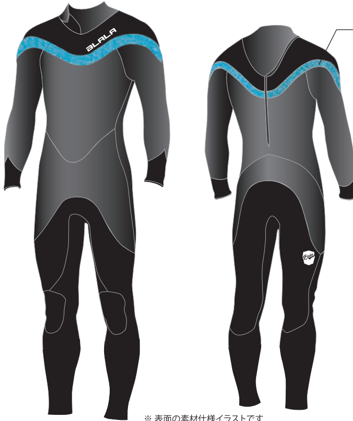
※ 表面の素材仕様イラストです

基本スペックをスーパーソニックと同じとするバックジップモデル。 価格はセミドライパッケージ価格となっております。 ファスナーは、アクアシール(簡易防水ファスナー)です