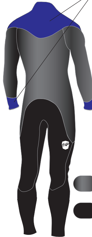
※ 表面の素材仕様イラストです