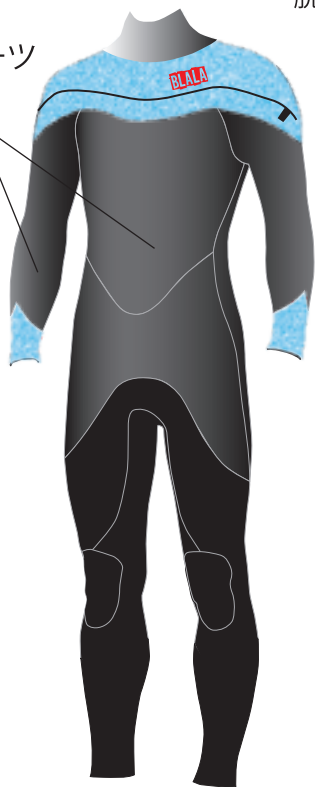
※ 表面の素材仕様イラストです

ロングネックまたはショートネックが選べます (ご指定がない場合はロングネックになります)