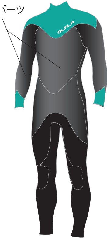
※ 表面の素材仕様イラストです