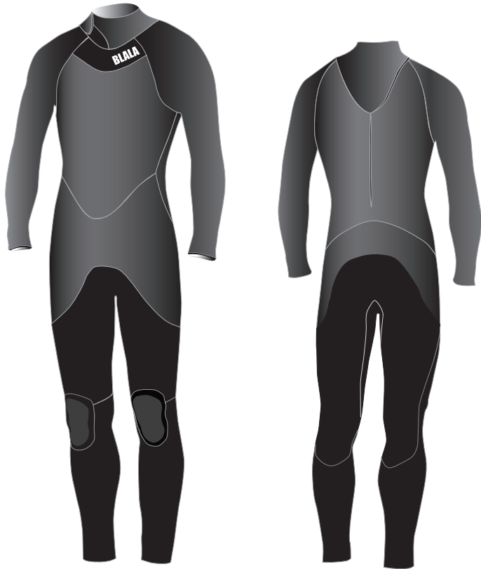
※ 表面の素材仕様イラストです